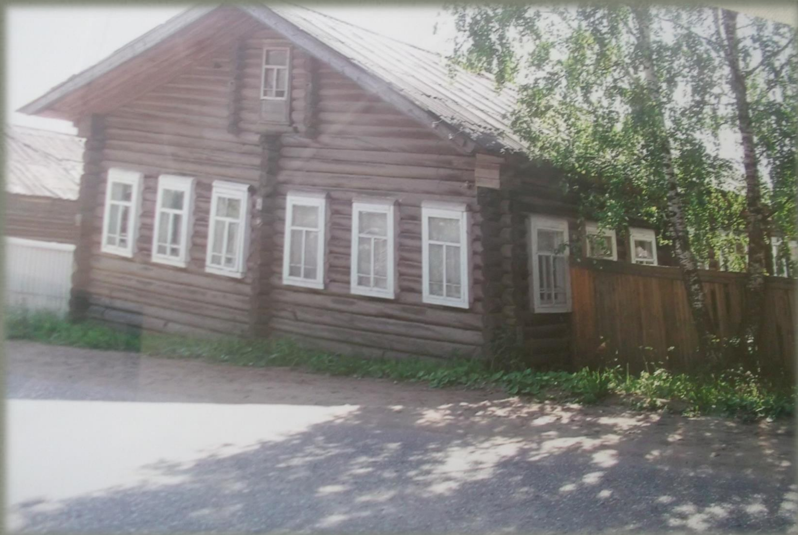
Село Выльгорт, деревня Сорма