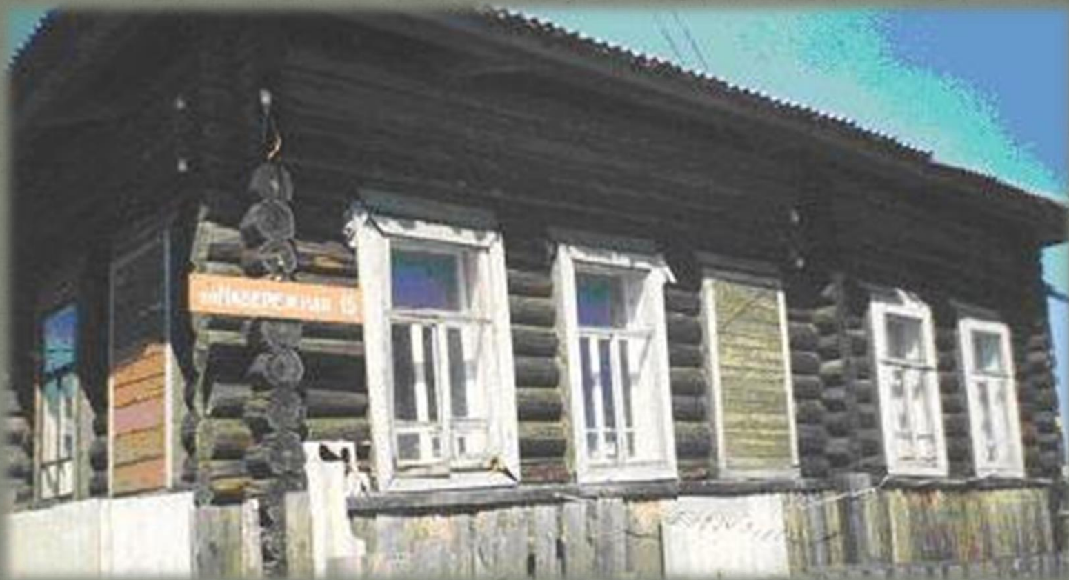
Школа, мастерские, контора