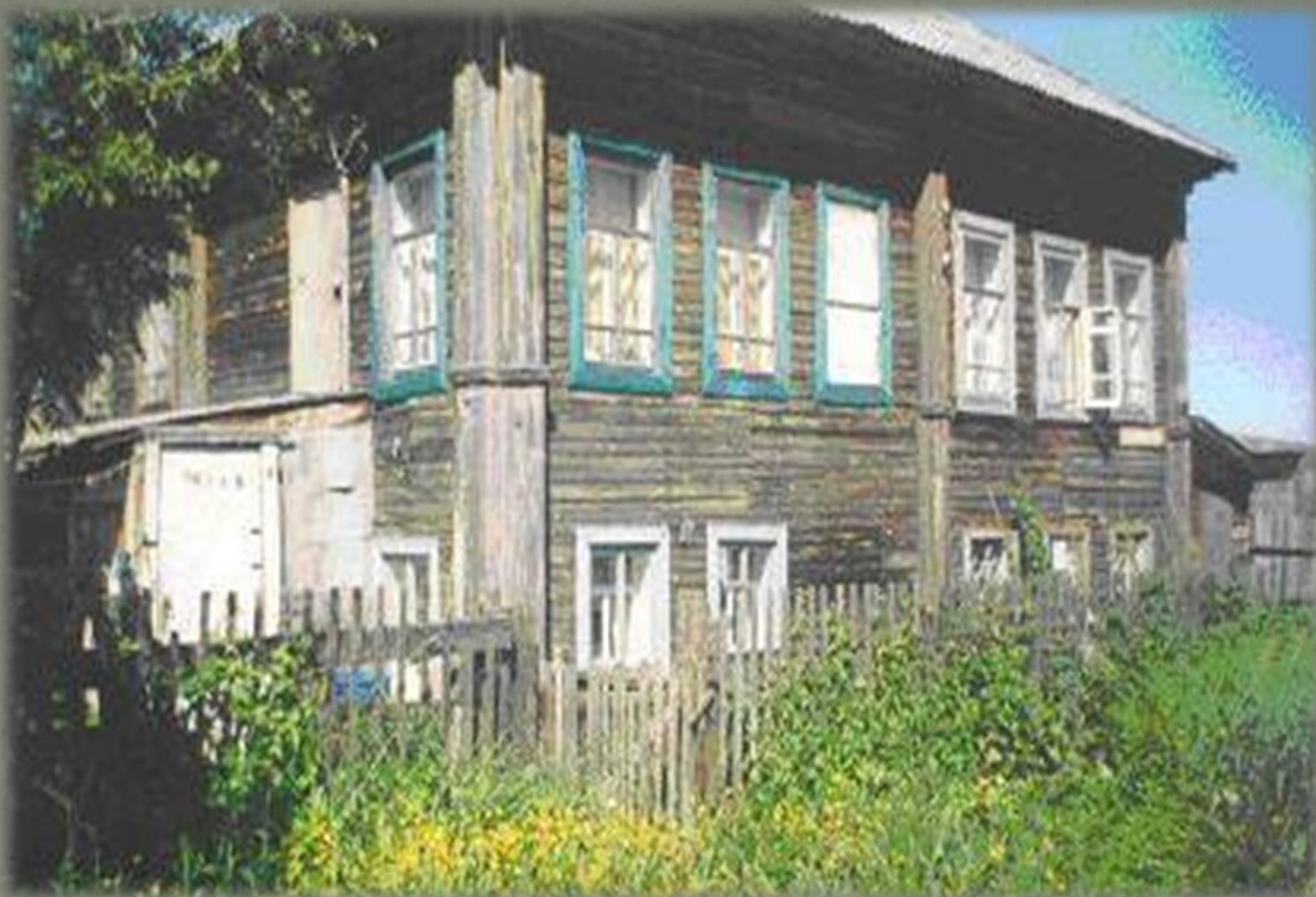
«Люба дом» корпус № 3