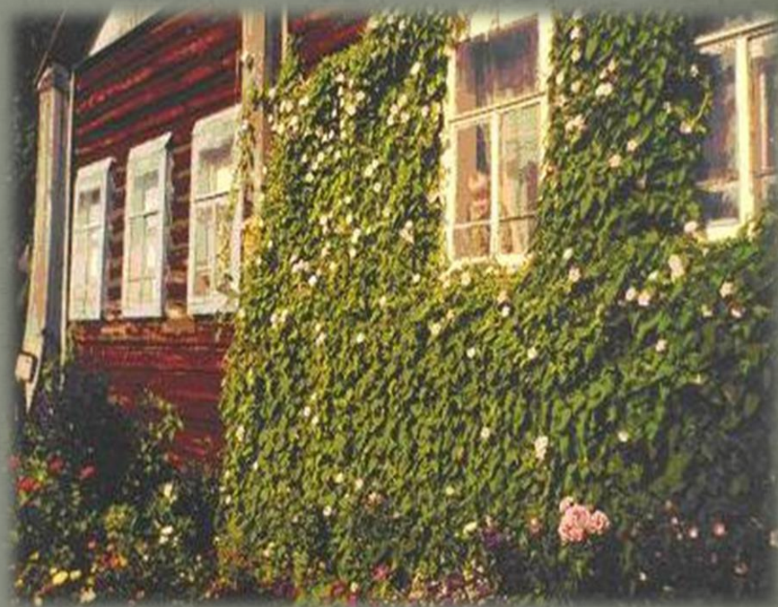
«Матрос дом» корпус № 2