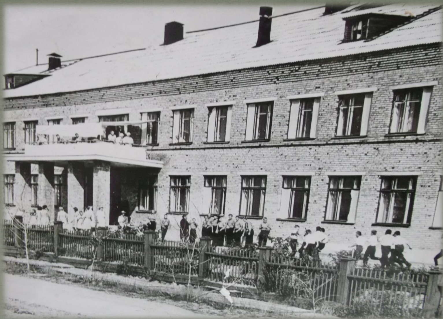
Первый корпус интерната